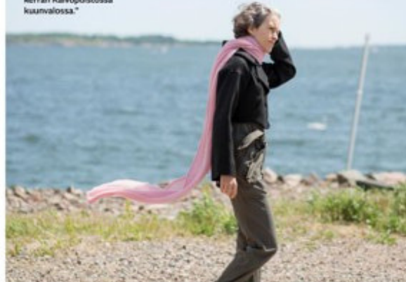
"On vaikuttavaa, miten metsä ja meri ovat läsnä Helsingin keskustan tuntumassa. Missä muualla pääkaupungissa voisi törmätä vielä huuhaajaan? Näin sellaisen kerran Kaivopuistossa kuormalossa."

"Ranskassa minulla ei olisi mahdollisuutta asua näin."